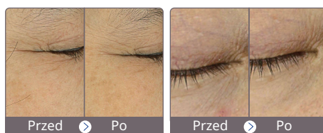
Antiaging i zmarszczki